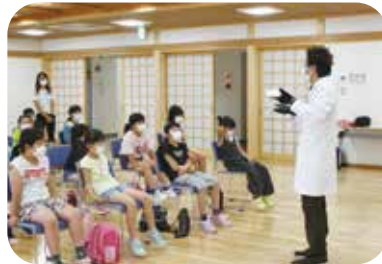
▼あっとほうむ科学実験隊のお兄さんの話にみんなくぎ付け