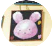
▲ブラックボードに思い思いの図柄を描きました