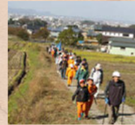
▲フットパス体験会