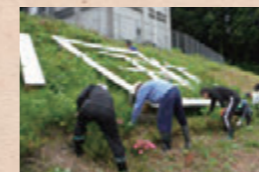
▲国体PR看板草刈 ▲城東グラウンド横に花壇を設置