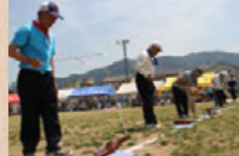
▲のうね健康まつり