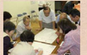
▶避難所運営ゲーム「HUG」